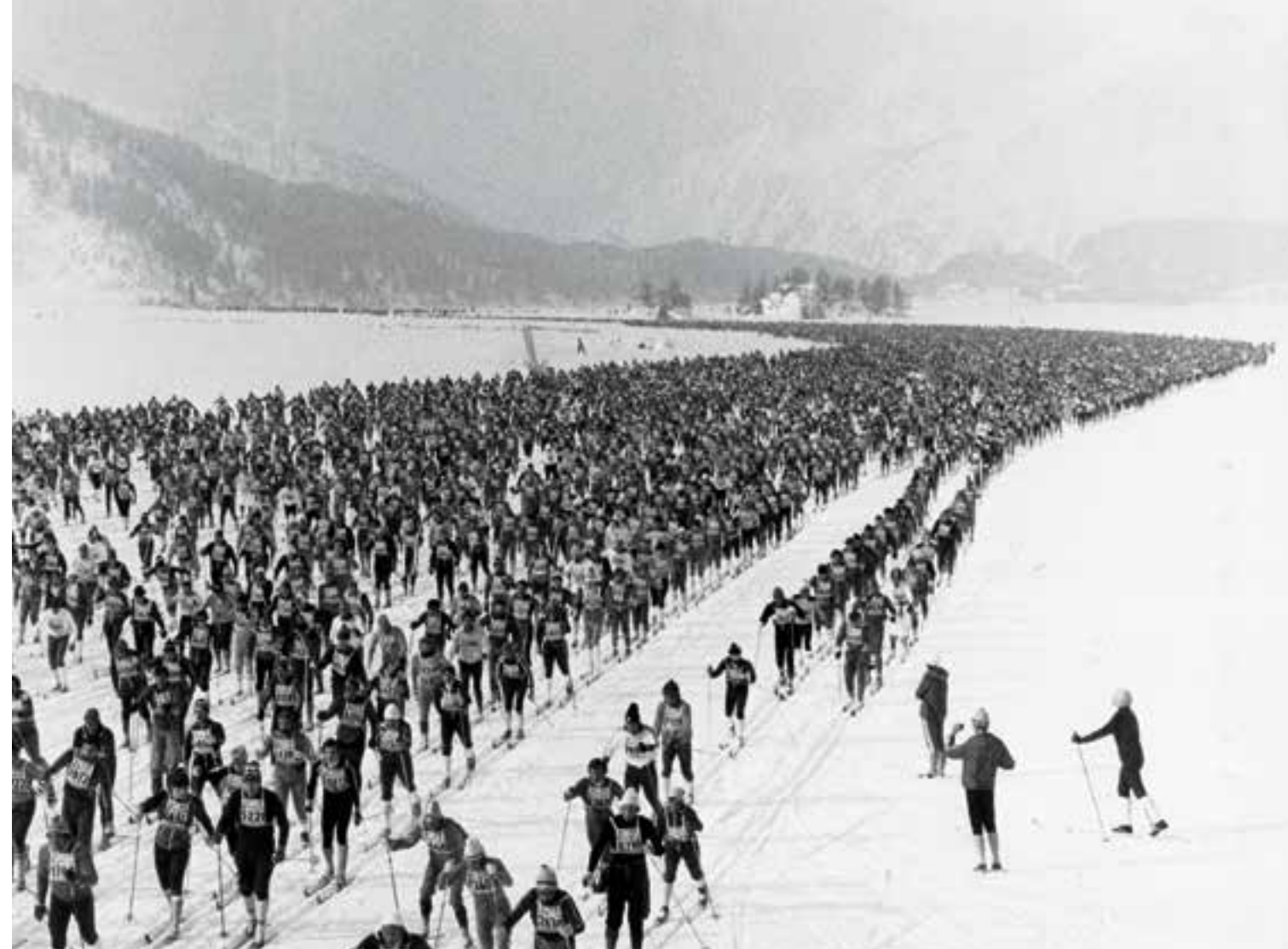
Beim 8. Engadin Skimarathon 1976 liefen die gegen 10 000 Teilnehmer noch brav in der Spur. Drei Jahre später waren die Spitzenleute bereits im Skatingstil unterwegs.

Ausgerechnet in Russland erfuhren die Ski eine andere Verwendung als die wettkämpferisch ausgerichtete des Westens. Bezeichnenderweise nach der kommunistischen Oktoberrevolution wurden sie als «Quelle der Gesundheit» für die proletarischen Massen gepriesen. Damals wurden Volksläufe durchgeführt, die neben der gesundheitlichen Fitness der Teilnehmer auch die Grösse und Schönheit der