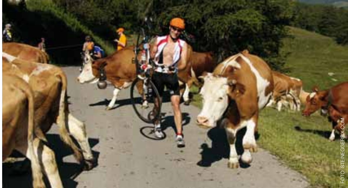
Manchmal gibt es auch schlicht eine «höhere Gewalt», welche die Anforderungen eines Gigathlons unvorhersehbar macht.

zu verkraften, die Zentral- und Etappenorte platzen jetzt schon aus den Nähten.» Die Gigathlon-Entwicklung hin zur perfekt inszenierten Grossveranstaltung ist für Wirz nachvollziehbar und logisch: «Dass die ersten beiden Gigathlons so hart wurden, lag in der vom Veranstalter ewz gemachten Vorgabe, vom Bergell, wo der Strom produziert wird, an einem Tag entlang der Stromleitung nach Zürich, wo der Strom verbraucht wird, zu gelangen. Mit der Steigerung beim Siebentage-Gigathlon wurde dann ganz bewusst eine neue und noch härtere Dimension erschlossen. Die folgenden Jahre wurden die Anforderungen auf höchstem Niveau belassen und gleichzeitig eine Verbesserung der organisatorischen und ökologischen Abläufe